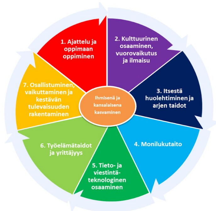
Kuva: Laaja-alaisen osaamisen kokonaisuus. (Lähde: Perusopetuksen opetussuunnitelman perusteet 2014.)

Perusopetuksen opetussuunnitelman perusteisiin (2014) on kirjattu seitsemän laaja-alaista osaamiskokonaisuutta. Niiden yhteisenä tavoitteena on tukea ihmisenä kasvamista sekä edistää demokraattisen yhteiskunnan jäsenyyden ja kestävän elämäntavan edellyttämää osaamista.